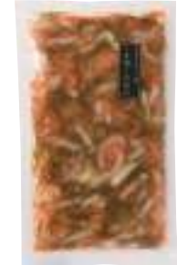
(株)ヤマヨ 冷蔵 いか刺し松前漬 (300g) 【⑦-008】 800円