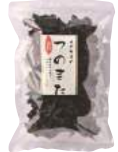
(株)オダカネ つのもた (30g) 【⑨-003】