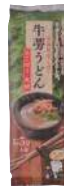
(有)柏崎青果 ごぼううどん (180g) 【⑳-005】 378円