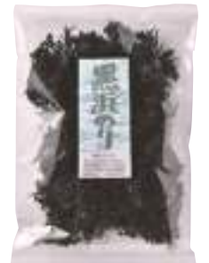
(有)大久保太郎商店 黒浜のり (20g) 【⑨-006】