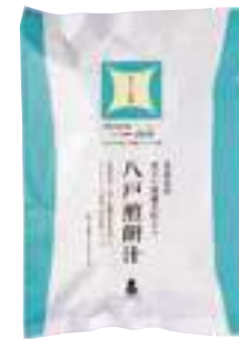
(株)創季屋 青天の霹靂 米粉入り 八戸煎餅汁 (4人分)【⑤-002】 700円 具材なし