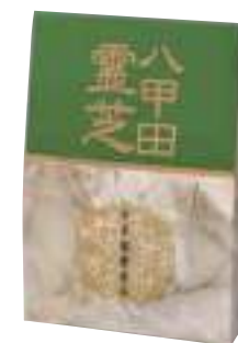
(株)東北産業 八甲田霊芝 (100g) 【⑳-003】 3,780円