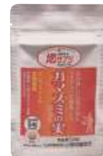
(株)小野寺醸造元 ガマズミの実サプリ (50粒) 【⑳-002】 1,296円