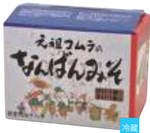
コムラ醸造(株) 冷蔵 なんばんみそ(化粧箱) (120g×6)(甘口×3・辛口×3) 【19-003】 1,337円