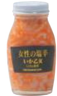
マルヨ水産(株) 冷蔵 いか乙女 (180g) 【⑦-005】 545円