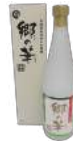
(株)泉農場 ながいも焼酎 「郷の華」 (720ml) 【29-010】 2,420円