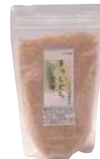
山部商店 まっしぐら玄米 (500g) 【⑳-008】 260円