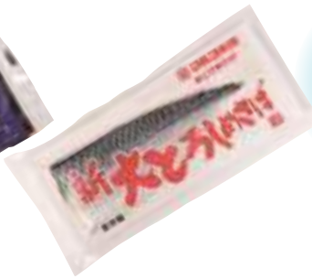
マルヨ水産(株) 新大とろしめさば (1枚)【⑩-003】 414円