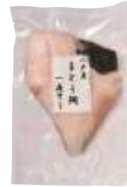
五戸水産(株) 冷凍 八戸産まとう鯛 一夜干し (1枚) 【⑨-012】