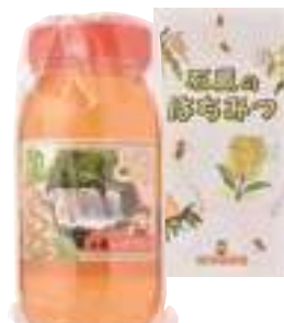
(有)東養蜂場 とち蜜 (1kg) 【⑳-006】 3,402円