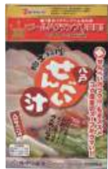
(株)味の加久の屋 八戸せんべい汁 コク塩味 (3人分)【④-002】 1,080円 具材入り