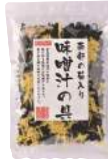
(株)オダカネ 菊入り味噌汁の具 (65g) 【⑨-007】