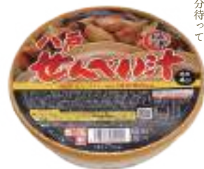
八戸東洋(株) 八戸郷土料理 カップせんべい汁 (しょうゆ味・1人分)【④-004】 540円 具材入り

郷土料理の「ごちそう煮」と 「せんべい汁がまきか」のコラボ。 高級感あふれる一品をどうぞ。