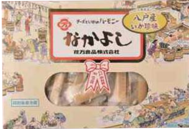
花万食品(株) なかがよし (120g) 【⑧-001】