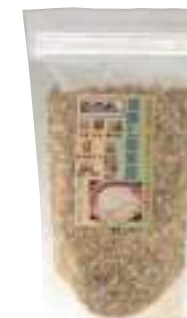
山部商店 健康七穀家族 (250g) 【⑳-009】 495円