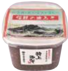
(株)小野寺醸造元 特上みそ(米みそ) (1kg) 【19-006】 540円