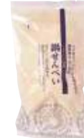
(同)たちばな 鍋せんべい (10枚) 【⑤-009】 230円