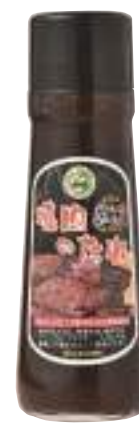
(株)TAKKO商事 黒にんにく 焼肉のたれ (250g)【17-002】 864円