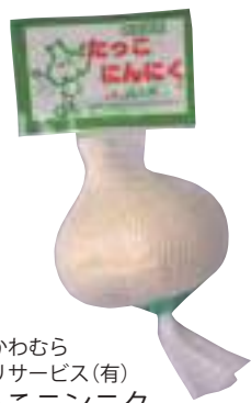
田子かわむら アグリサービス(有) たっこニンニク (1個)【16-001】 390円