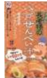
(株)味の海翁堂 長者様の八戸せんべい汁 (青森県産シャモロック使用) (3人分)【⑤-004】 1,080円 具材入り