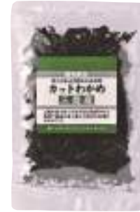
(株)オダカネ カットわかめ (30g) 【⑨-002】