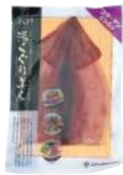
五戸水産(株) 冷蔵 湯くぐり美人 (1枚) 【⑥-004】 620円