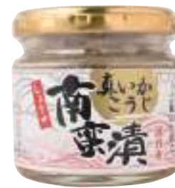
五戸水産(株) 冷蔵 真いかこうじ南蛮漬 (100g) 【⑦-009】 432円