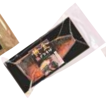
(同)マルカネ 黄金焼とろさば (1枚)【⑩-008】 756円