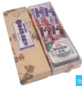
コムラ醸造(株) 冷蔵 なんばんみそ5個セット (120g×4・130g×1) (甘口×2・辛口×2・山椒入×1) 【19-004】 1,200円