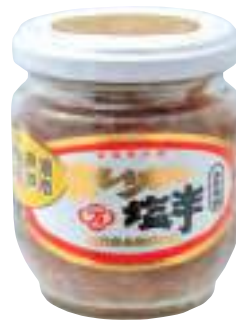
花万食品(株) 冷蔵 まいか塩辛(特上) (160g) 【⑦-001】 810円