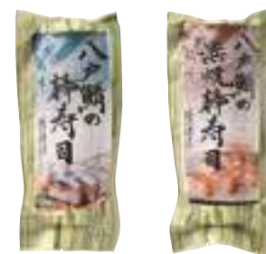
(株)ディメール 八戸鯖の棒寿司 (250g)【⑩-003】 1,008円 八戸鯖の浜焼棒寿司 (250g)【⑩-004】 1,008円