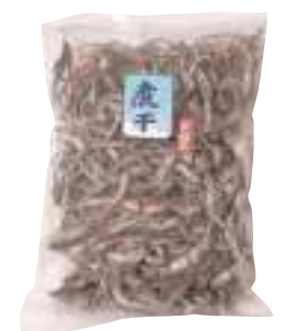
(有)大久保太郎商店 煮干いわし (200g) 【⑨-009】 (350g) 【⑨-010】