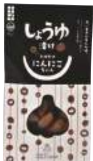
田子町にんにく国際交流協会 にんにくしょうゆ漬け (100g)【16-007】 648円