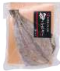
(株)ヤイチ しまほっけ 一夜干し (1枚) 【⑧-011】