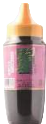
南郷物産協会 幻のはちみつ (そば) (500g) 【⑳-003】 2,484円