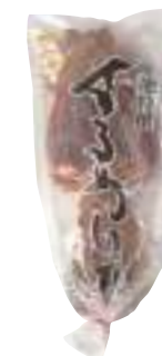
五戸水産(株) 冷蔵 干しするめ (3枚) 【⑧-005】 1,380円