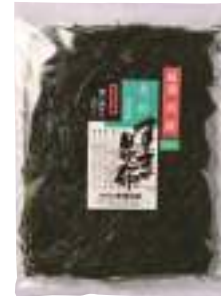
(株)オダカネ すき昆布 (2枚入) 【⑨-004】