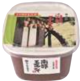
(株)小野寺醸造元 南部玉みそ (1kg) 【19-005】 540円