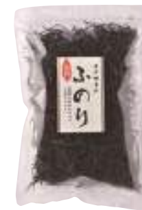
(株)オダカネ ふのり (30g) 【⑨-005】