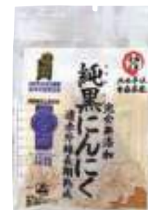
(株)岡崎屋 純黒にんにく (1個入)【17-010】 540円