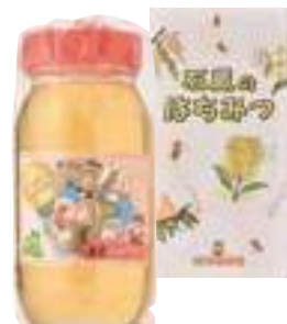
(有)東養蜂場 アカシヤ蜜 (1kg) 【⑳-004】 4,633円