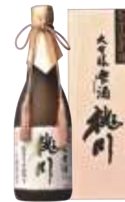
桃川(株) 桃川「大吟醸雫酒」 (720ml) 【29-001】 5,500円