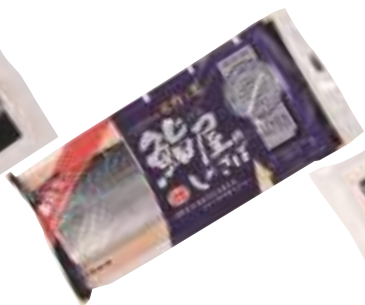
(株)ディメール 鮪屋のしめさば (1枚)【⑩-002】 432円