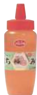
山内養蜂園 アカシヤ蜜 (500g) 【⑳-007】 2,500円