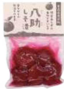
(株)アグリーデザイン 八助のしそ漬 (240g) 【19-009】 724円