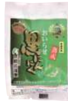
(有)柏崎青果 おいらせ熟成 黒にんにく (1個入)【17-007】 756円