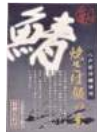
(株)ヤイチ 鯖さば飯の素 (2合×2回分)【⑩-007】 700円