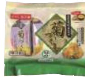
南部特産品振興委員会 菊づくし (2個入×6袋) 【19-001】 800円