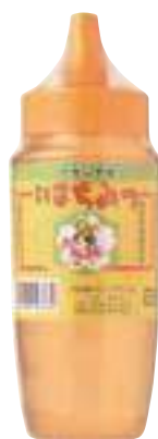
南郷物産協会 アカシヤ蜜 (500g) 【⑳-002】 2,484円