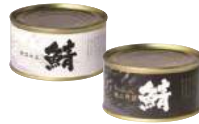
(株)GMK(金剛グループ) 鯖水煮缶(厳選) (180g)【⑩-008】 800円 鯖水煮缶(極上) (180g)【⑩-009】 950円