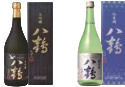
八戸酒類(株) 八鶴「大吟醸」 (720ml) 【28-001】 3,356円