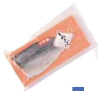
(株)ヤイチ しめさば (1枚)【⑩-004】 460円