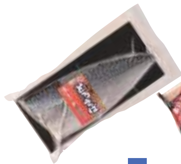
(同)マルカネ 刺身とろさば生しめ (1枚)【⑩-001】 756円