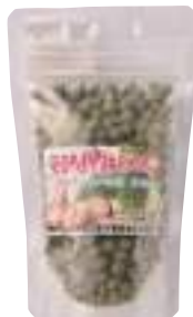
南郷物産協会 モロヘイヤにんにく (80g)【16-006】 972円