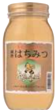
南郷物産協会 アカシヤ蜜 (1kg) 【⑳-001】 4,752円