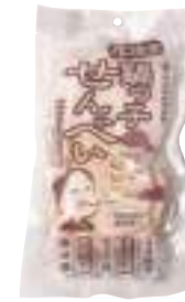
(株)味の海翁堂 南部庵 鍋っ子せんべい (8枚) 【⑤-008】 216円