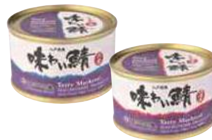
(株)味の加久の屋 味わい鯖(水煮) (200g)【⑩-010】 432円 味わい鯖(味噌煮) (200g)【⑩-011】 432円