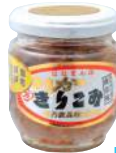
花万食品(株) 冷蔵 いかきりこみ(南蛮味) (160g) 【⑦-002】 810円