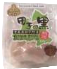
(株)TAKKO商事 田子の黒 (1個入)【17-008】 594円