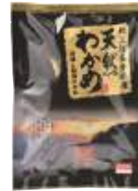
(株)オダカネ 冷蔵 天然わかめ (80g) 【⑨-001】