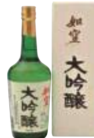
八戸酒類(株) 如空「大吟醸」 (720ml) 【28-003】 3,357円