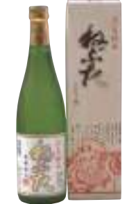
桃川(株) ねぶた「淡麗純米」 (720ml) 【29-004】 1,122円