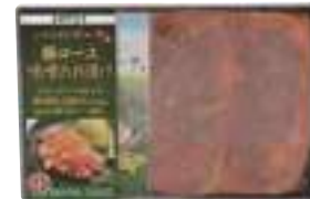
美保野グリーン牧場(株) 冷凍 八戸美保野ポーク 豚ロース味噌たれ漬け (3枚入) 【19-008】 1,080円