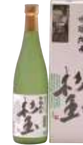
桃川(株) 杉玉「吟醸純米」 (720ml) 【29-003】 1,650円