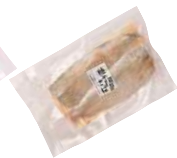
(同)マルカネ 糠干しさば (2枚入)【⑩-009】 420円