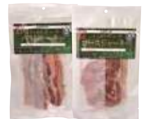
美保野グリーン牧場(株) 冷凍 八戸美保野ポークジャーキー パラ(43g) 【19-011】 ロース(41g) 【19-012】 各 600円