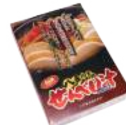
八戸東洋(株) 八戸郷土料理せんべい汁 (しょうゆ味・4人分)【⑤-005】 1,080円 具材入り