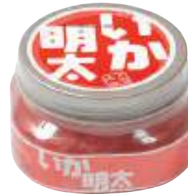
マルヨ水産(株) 冷蔵 いか明太 (150g) 【⑦-006】 623円