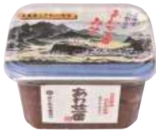
(株)小野寺醸造元 あわせ一番 (500g) 【19-007】 324円