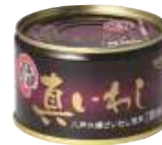
(株)宝幸八戸工場 真いわし醤油味缶詰 (200g)【⑩-012】 350円