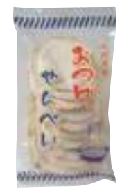
(有)上館せんべい店 おつゆせんべい (10枚) 【⑤-010】 238円

煮立った鍋にせんべいを割り入れ煮込み、お好みの硬さでお召し上がりください。(目安は5分です)