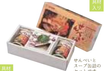
(株)味の加久の屋 せんべい汁セット (2~4人分)【⑤-006】 2,376円 具材入り