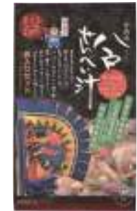
(株)創季屋 八戸せんべい汁 (青森県産鶏具入りセット) (3~4人分)【⑤-003】 1,080円 具材入り