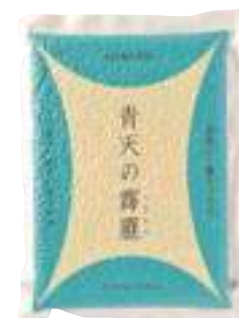
(株)ライケット 青天の露露 (300g・2合分) 【⑳-007】 432円