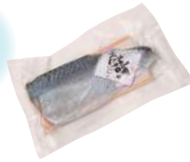
(株)ホテル八甲 虎鯖(メ鯖刺し) (1枚)【⑩-001】 1,296円

八戸前沖は、日本のサバの漁場としては本州最北端に位置しています。中でも「八戸前沖さば」は、八戸前沖さばブランド推進協議会が認定した期間に八戸前沖で漁獲し、八戸港に水揚げされたサバのことを言います。脂肪分はおおむね15%以上を目安とし、大型の銀鯖は30%以上の大トロにも匹敵する脂肪分の鯖もあります。八戸の「しめさば」や「鯖缶」は絶品です。