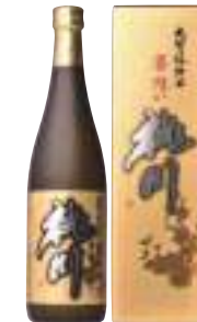
桃川(株) 桃川「大吟醸華想い」 (720ml) 【29-002】 2,200円