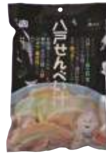
(株)味の海翁堂 八戸せんべい汁 (2人分)【⑤-001】 648円 具材入り