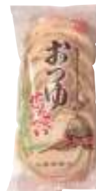
矢野 おつゆせんべい (10枚) 【⑤-007】 232円