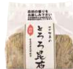
(株)オダカネ とろろ昆布 (72g) 【⑨-008】