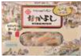
花万食品(株) なかがよし (カマンベール) (120g) 【⑧-002】