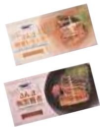
武輪水産(株) さんま蜂蜜レモン煮 (4切入) 【⑧-007】 さんま梅黒糖煮 (4切入) 【⑧-008】