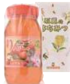
(有)東養蜂場 りんご蜜 (1kg) 【⑳-005】 3,402円