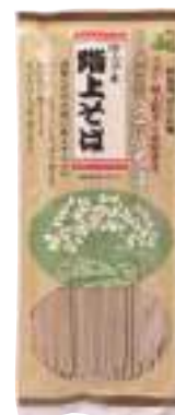
階上町 わっせ交流 センター 階上早生 階上そば (200g) 【⑳-004】 390円