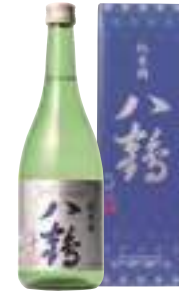
八戸酒類(株) 八鶴「純米酒」 (720ml) 【28-002】 1,430円