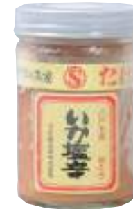
武輪水産(株) 冷蔵 いか塩辛(極上・皮むき) (180g) 【⑦-003】 1,188円