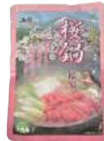
(有)尾形精肉店 桜宴(馬肉鍋の素) (300g) 【19-005】 1,730円