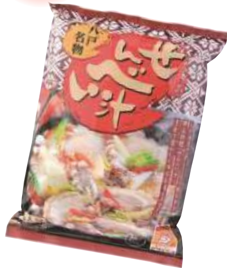
せんべい汁生産協力会 八戸名物「せんべい汁」 (4人分)【④-001】 648円 具材なし

お好みの具材を入れて煮込むだけで 出来上がり。 コクのあるスープが大変美味しいと 評判です。