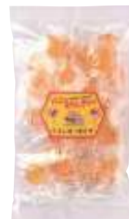
山内養蜂園 ハニーキャンディー (100g) 【⑳-010】 473円