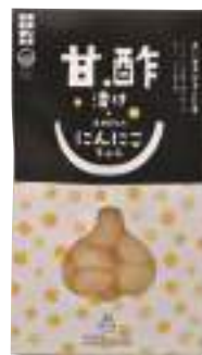
田子町にんにく国際交流協会 にんにく甘酢漬け (100g)【16-009】 648円