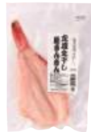
三富産業(株) 定塩生干し 開きんきん (1枚) 【⑧-010】