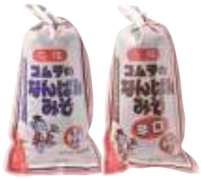
コムラ醸造(株) 冷蔵 なんばんみそ(甘口) (230g) 【19-001】 362円 なんばんみそ(辛口) (230g) 【19-002】 362円