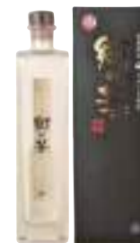
(株)泉農場 ながいも焼酎 「郷の華」原酒(38°) (500ml) 【29-009】 6,050円