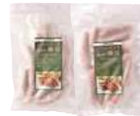
美保野グリーン牧場(株) 冷凍 八戸美保野ポーク腸詰 バジル&オニオン味(320g) 【19-009】 ブラックペッパー味(320g) 【19-010】 各 600円