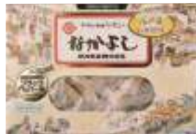
花万食品(株) なかがよし (ブラックペッパー) (120g) 【⑧-003】