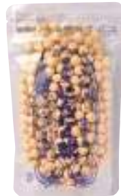
にんにく球製造所 にんにく球 (90g)【16-005】 1,296円