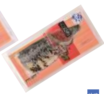
武輪水産(株) たたきしめさば (1枚)【⑩-006】 520円