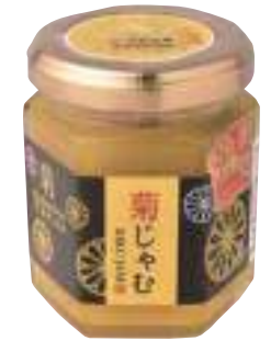
(有)村井青果 菊じゃむ (120g) 【19-004】 680円