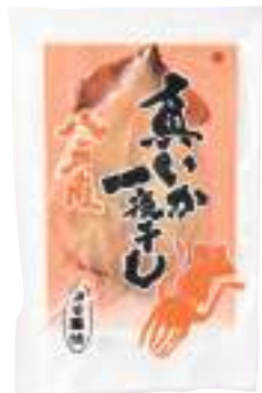
五戸水産(株) 冷蔵 真いか一夜干し (みそ風味) (1枚) 【⑥-003】 770円