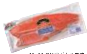
(株)ヤマヨ 定塩紅鮭 (甘口) (1枚) 【⑧-009】