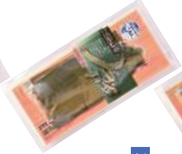
武輪水産(株) 昆布じめしめさば (1枚)【⑩-005】 520円