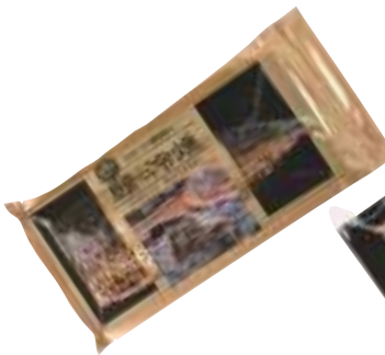
(株)ディメール 鯖の冷薫 (1枚)【⑩-007】 597円