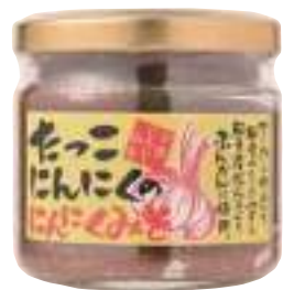
田子町にんにく国際交流協会 たっこにんにくのんにくみそ (150g)【16-002】 648円

青森県田子町は「日本一のにんにくの里」として全国的に有名で、 糖度が高く味香りとも一級品です。 「田子にんにく」を使用した黒にんにくをはじめとした加工品をお試し下さい。