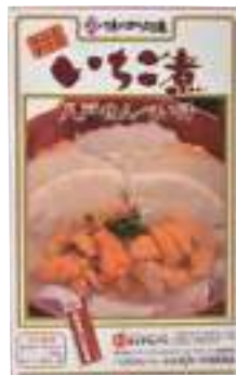
(株)味の加久の屋 いちご煮 八戸せんべい汁 (3人分)【④-003】 1,404円 具材入り