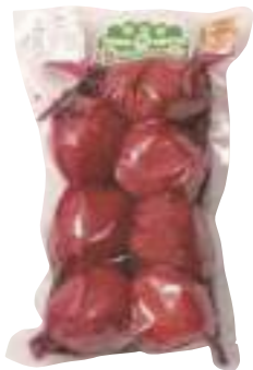
南郷物産協会 冷蔵 南部八助梅漬 (500g) 【19-008】 720円