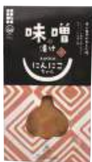
田子町にんにく国際交流協会 にんにく味噌漬け (100g)【16-008】 648円