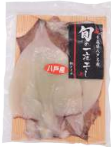
(株)ヤイチ 冷蔵 いか一夜干し (2枚) 【⑥-001】 970円