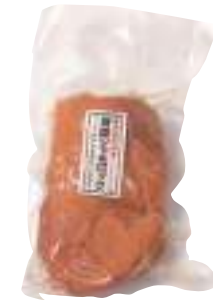
(株)グローバルフィールド 青森シャモロック燻製(もも肉) (1枚) 【19-006】 1,560円