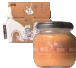
田子町にんにく国際交流協会 TAKKO Garlic jam (120g)【16-004】 1,000円