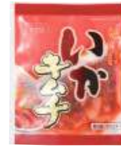
武輪水産(株) 冷蔵 いかキムチ (80g) 【⑦-007】 180円