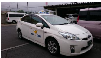
送迎移動ポストタクシー