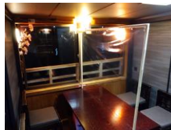
船内コロナ対策個室化