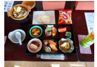
昼の部：2千円郷土料理セット