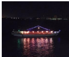
八戸港内航行風景