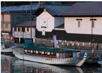
八戸屋形船発着桟橋・八戸酒造酒蔵前