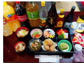
夜の部：3千円郷土料理&飲み放題セット