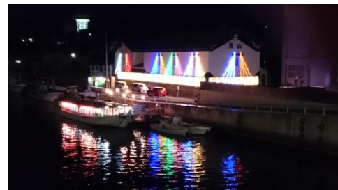
夜の屋形船桟橋風景